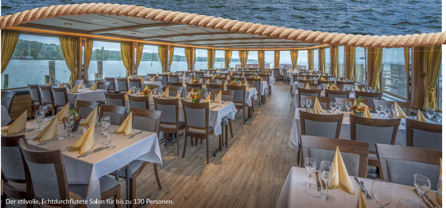
Der stilvolle, lichtdurchflutete Salon für bis zu 130 Personen.