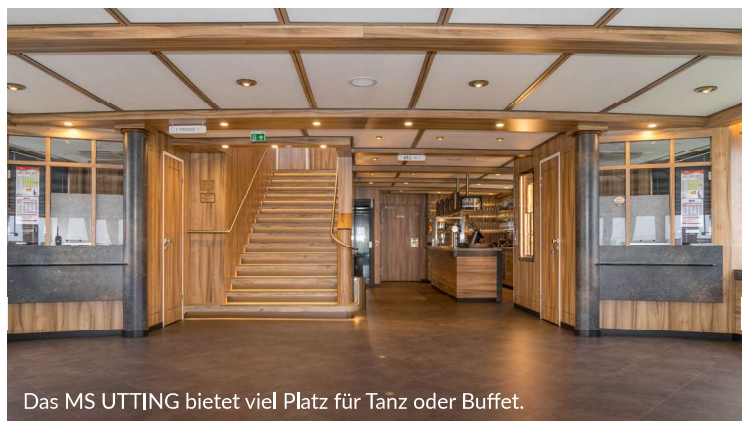
Das MS UTTING bietet viel Platz für Tanz oder Buffet.