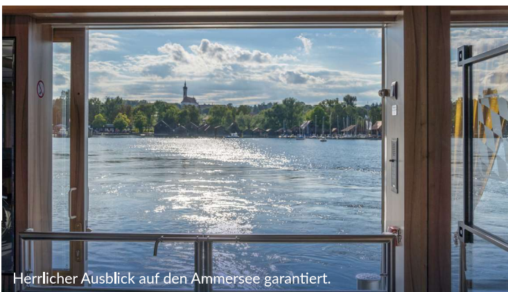
Herrlicher Ausblick auf den Ammersee garantiert.